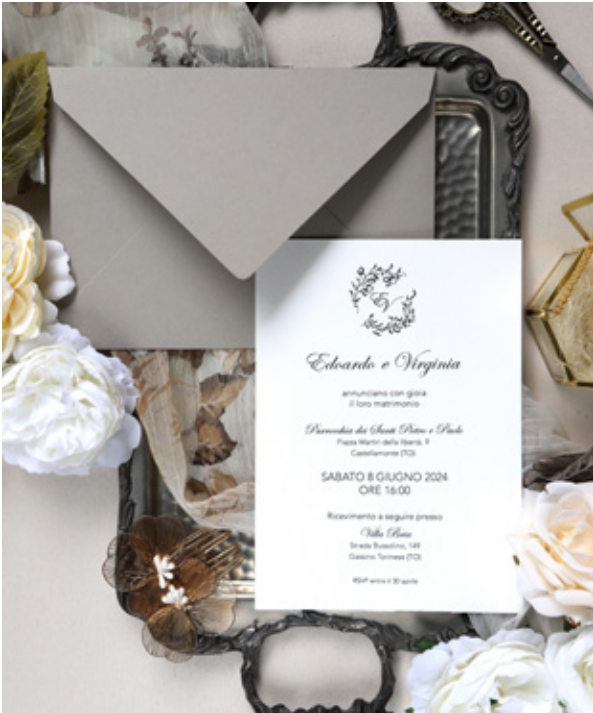
Partecipazioni su misura