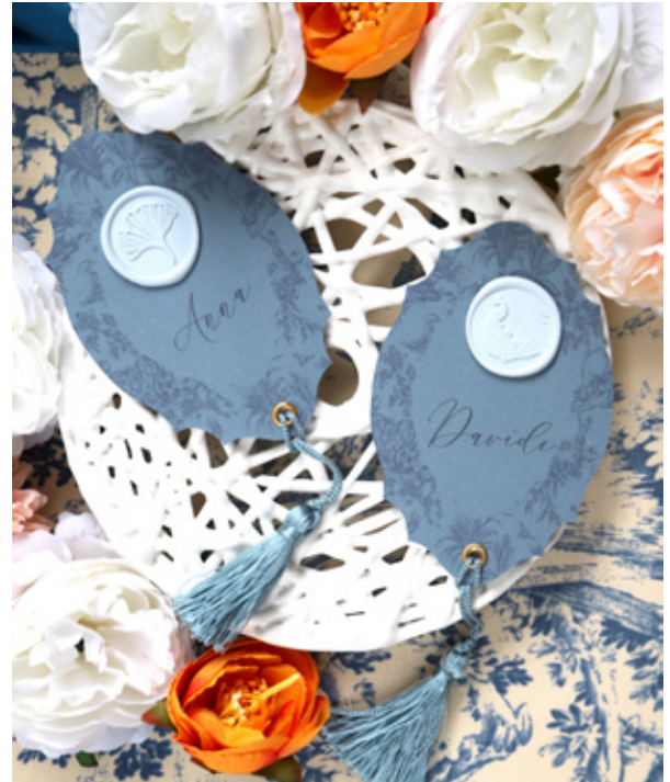
Cartoleria per il matrimonio