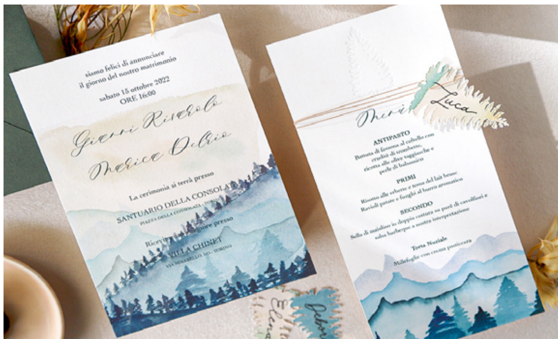
Illustrazioni e pitture personalizzate